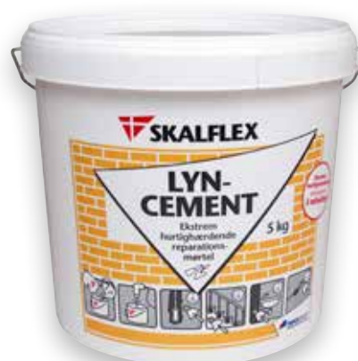
5 kg, DB-nr: 1526015